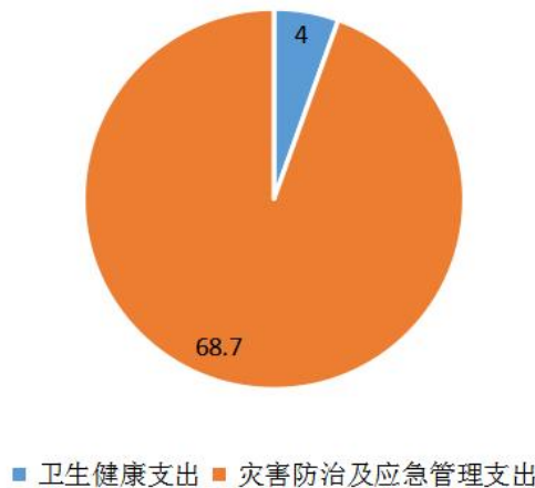
财政拨款收支总预算

金华经济技术开发区消防救援大队2024年财政拨款收支总预算72.7万元。收入全部为一般公共预算拨款。支出包括：卫生健康支出4万元，灾害防治及应急管理支出68.7万元。