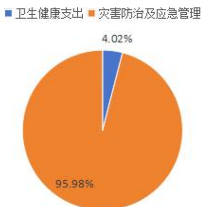
财政拨款收支总预算

金华市金东区消防救援大队2024年财政拨款收支总预算74.6万元。收入全部为一般公共预算拨款，包括：一般公共预算拨款本年收入74.6万元，上年结转0万元。支出包括：卫生健康支出3万元，灾害防治及应急管理支出71.6万元。